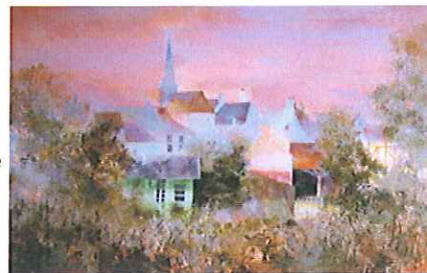
Marc LE COULTRE

Le succès de l'opération dépend de l'implication active de chacun.